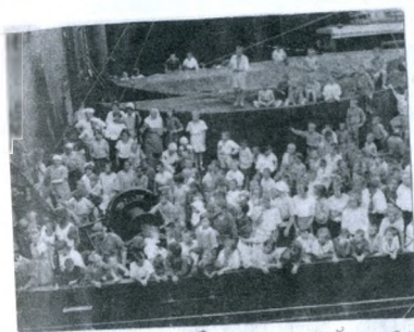
Проезжаем Панамский канал. Лягушки спасательные лодки, поставил в середину нижней палубы. Очень стало тесно. Этот снимок назвала «Кишмя кишмя».