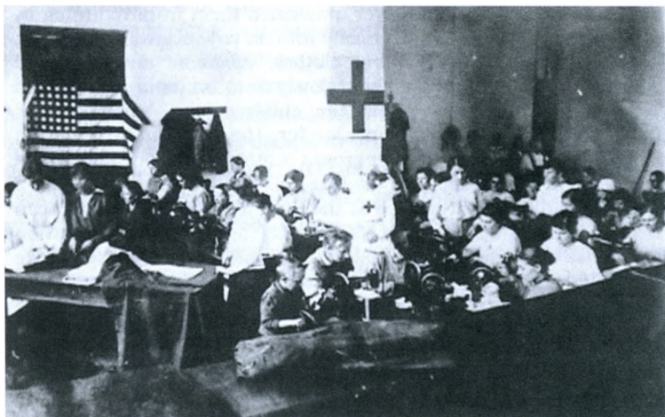
Мастерские, организованные Американским Красным Крестом для колонистов. Владивосток. 1919–20 гг.

Дополнительная информация по теме на сайте www.colonia.spb.ru