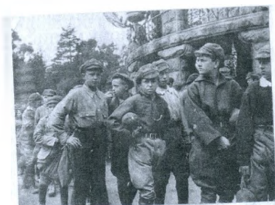
Группа колонистов проходит мимо павильона в ботаническом саду в Сан-Франциско.