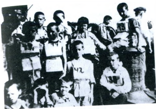
На борту «Йомей Мару». Младшие колонисты в спасательных жилетах. Учебная тревога.